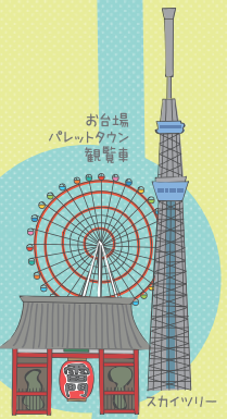
お台場 パレットタウン 観覧車